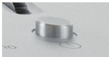
Abb. 3: Druckknopf

Falls das Gerät eine längere Zeit nicht in Benutzung ist, schalten Sie das Gerät oben am Druckknopf (siehe Bild) aus. Oder trennen Sie das Gerät komplett vom Stromnetz in dem Sie das Steckernetzteil aus der Steckdose entfernen.