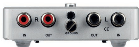
Abb. 2: Rückansicht

Bitte schließen Sie erst jetzt das Gerät an das Stromnetz an und schalten das Gerät ein!