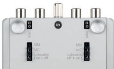
Pic. 1: View from the bottom side

First, select either the MC (moving coil) or MM (moving magnet) mode according to your cartridge type, by inserting the removable jumpers into the relevant positions on the bottom of the unit (one each for left and right channels). The subsonic-filter function can also be adjusted by inserting jumpers into the relevant points on the bottom of the unit: if the jumper is inserted, then the subsonic filter is OFF . If the jumper is not inserted, then the subsonic filter is ON .