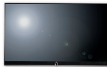
Table Stand Reference 55 , Алюминий